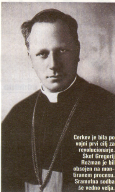
Cerkev je bila po vojni prvi cilj za revolucionarje. Skof Gregorij Rozman je bil obsojen na montiranem procesu. Sramotna sodba se vedno velja.

Po koncu vojne je bilo brez sodnega procesa ubitih okoli 13.000 domobrancev, mnogi so bili zaprti v razna taborišča, za katera še danes ni popolna jasno, kdaj naj bi jih prav-