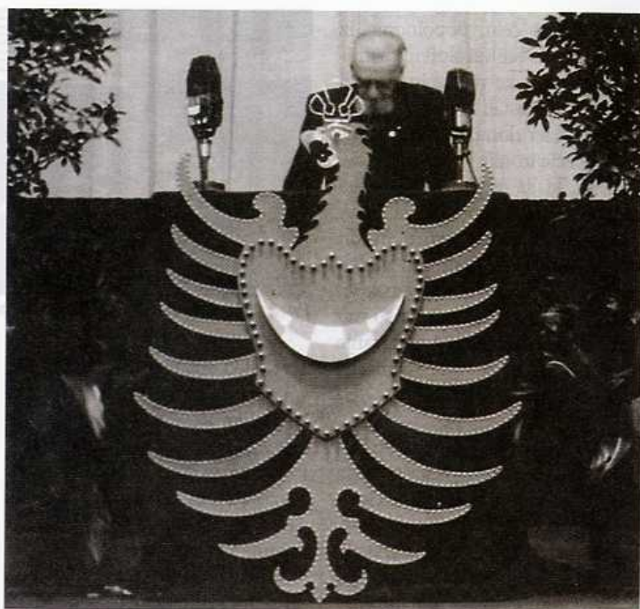
Leon Rupnik govori na zborovanju v Unionski dvorani.

▶ leta 1933 dobil čin brigadnega generala), in sicer kot načelnik štaba v komandi tretje vojne oblasti.