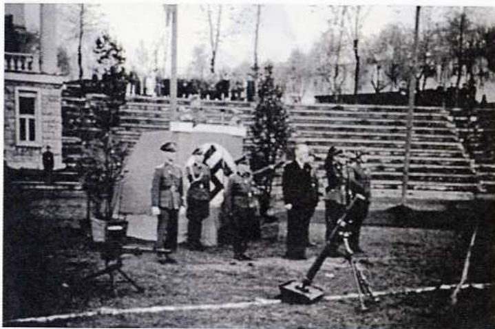
Eden od očitkov Rupniku je bila njegova navzočnost pri zaprsegi domobrancev.