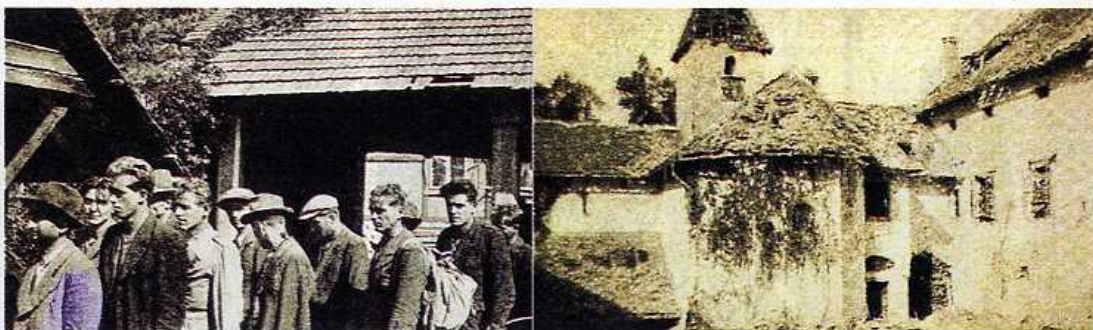
Pri razbitju vaških straž na Turjaku so partizani sprejeli pomoč poraženih italijanskih okupatorjev.

Leon se je odločil, da bo sledil očetu v državni službi, a si je raje izbral vojaško namesto uradniške kariere. Po končani nižji gimnaziji je s petnajstimi leti stopil v pehotno kadetnico v Trstu in jo po štirih letih zapustil s činom praporščaka-pripravnika. Po nekaj mesecih služenja v pehotnem polku v Varaždinu je končno dobil potrditev v čin poročnika in potem opravljal razne službe v Varaždinu in Bjelovarju. Kmalu so se nadrejeni odločili, da ga pošljejo za leto dni v šolo za inženirce; presodili so namreč, da bi lahko bil odlični inženirski oficir v pehotnih enotah. Opravljal je tudi nekaj drugih služb, bil je administrator v enoti in nekaj časa predavatelj na šoli enoletnih prostovoljcev, se pravi rezervnih oficirjev. Glede na to, da se je povsod izkazal, so nadrejeni sklenili, da bo iz Rupnika postal dober oficir, in ga poslali za dve leti na Dunaj, na generalštabno akademijo, kajti le uspešno končana akademija je omogočala dostop do visokih či-